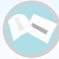
ระบบแผ่นฟอกอากาศ