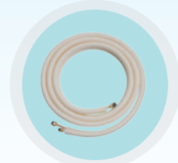
มีท่อน้ำยาสำเร็จรูปยาว 4 เมตรมากับเครื่อง